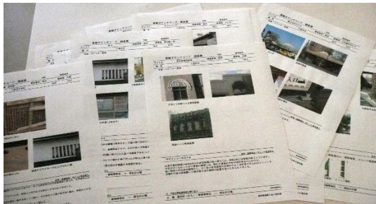
集められた警官ダビンチコード調査表