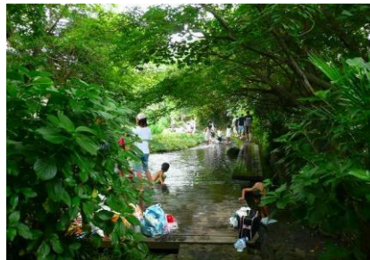
源兵衛川のせせらぎ